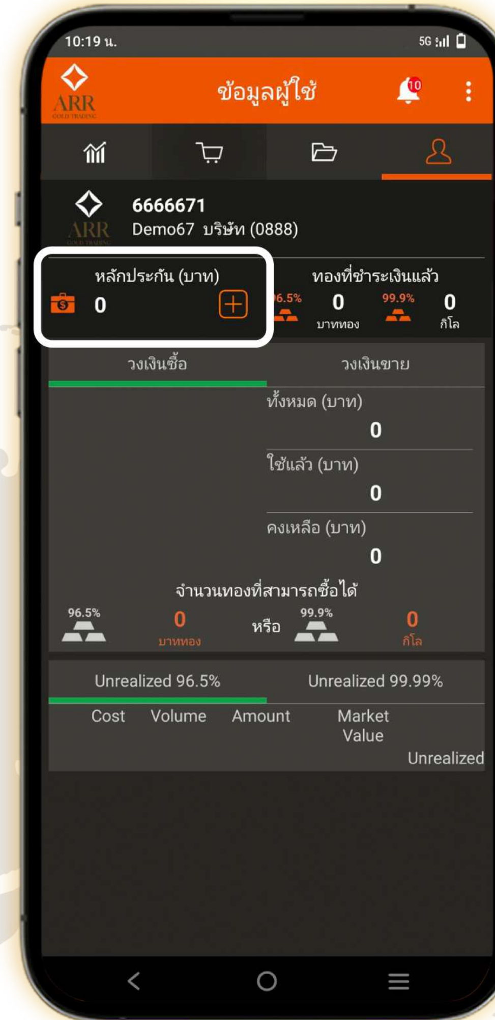
2. เลือก หลักประกัน (บาท)