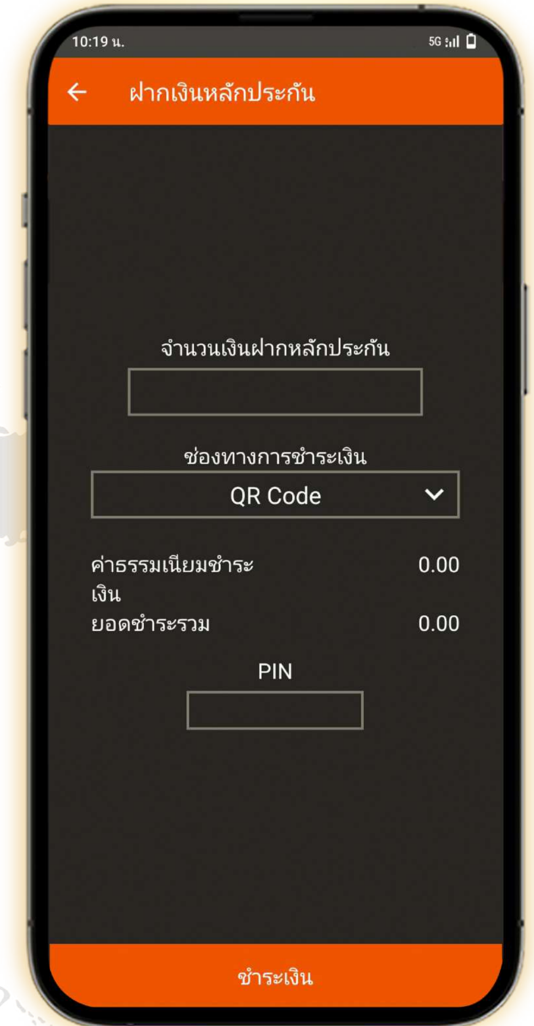
3. ระบุจำนวนเงิน ฝากเงินหลักประกัน ส่ PIN กด ชำระเงิน

** นำ QR Code ไปสแกนที่แอปพลิเคชันธนาคาร